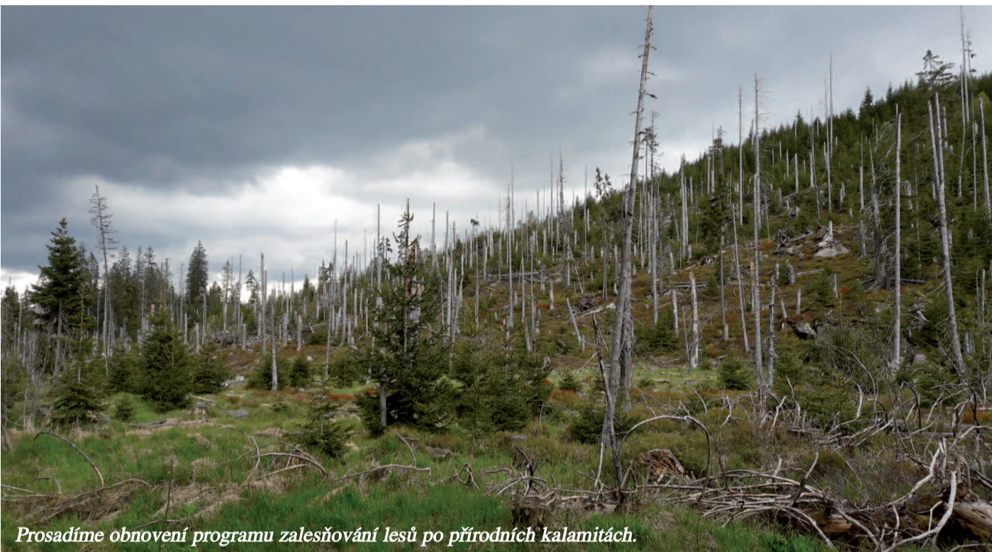
Prosadíme obnovu programu zalesňování lesů po přírodních kalamitách.