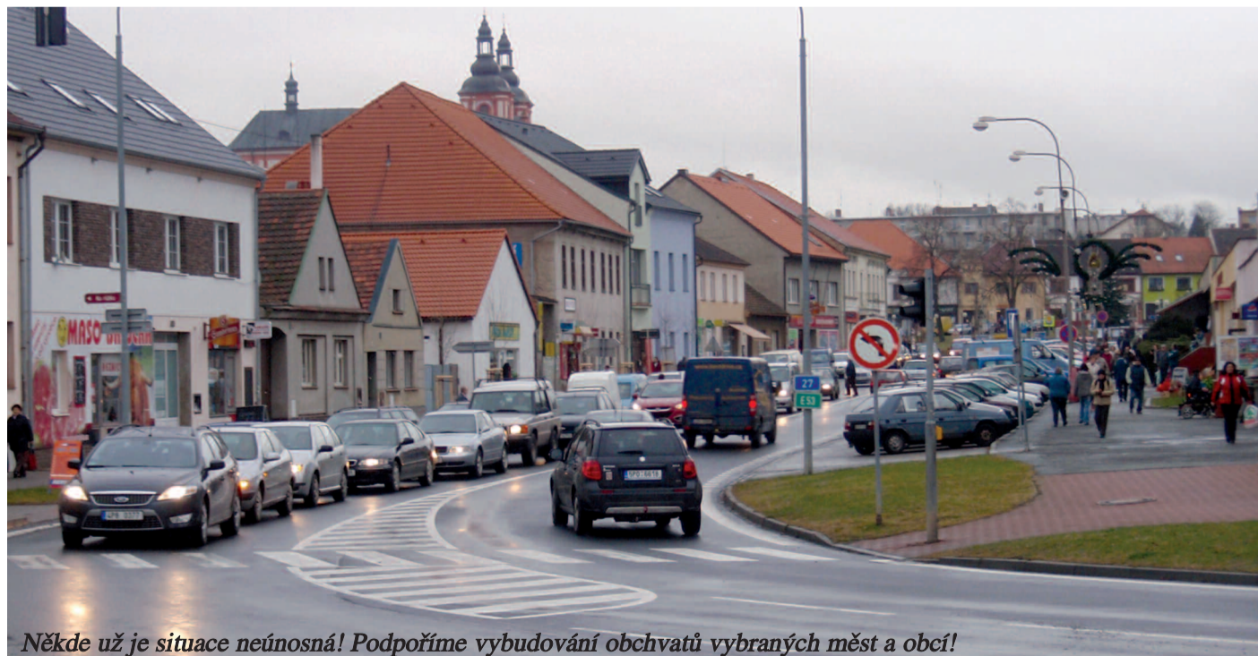
Někde už je situace neúnosná! Podpoříme vybudování obchvatů vybraných měst a obcí!