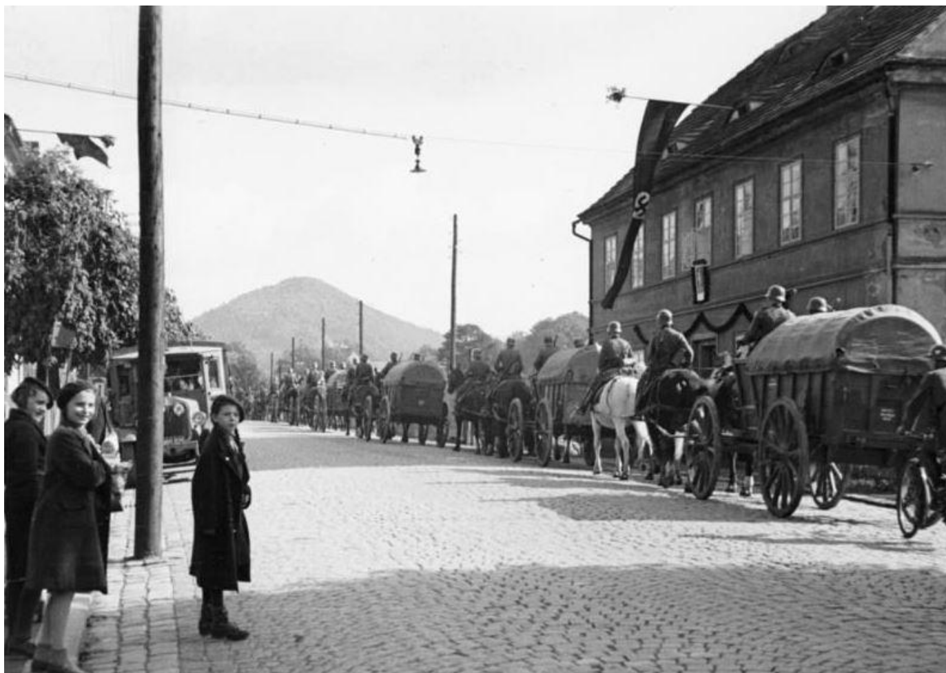
Vojenská kolona německé armády v České Kamenici - 7. října 1938.