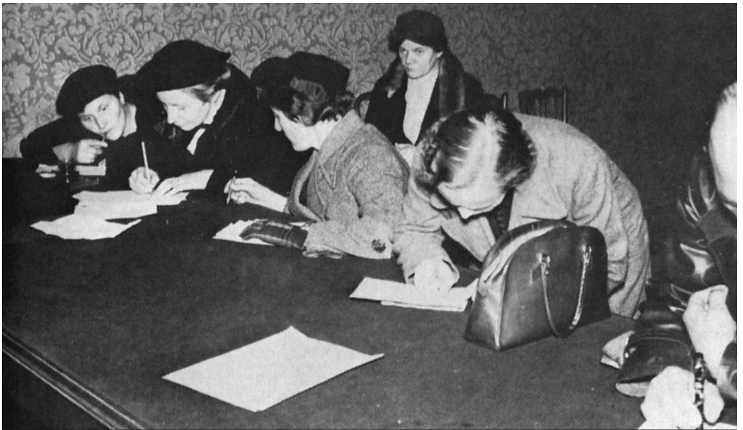
Odsunutí Češi při vyplňování registračních formulářů kvůli nouzovému ubytování. Praha, 13. října 1938.