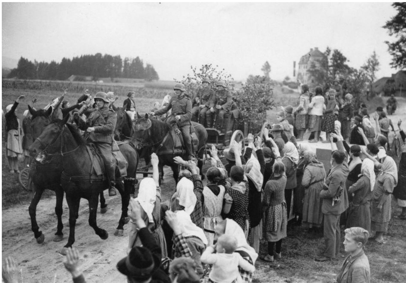
Tentokrát za doprovodu jásajících Němců z českého pohraničí.