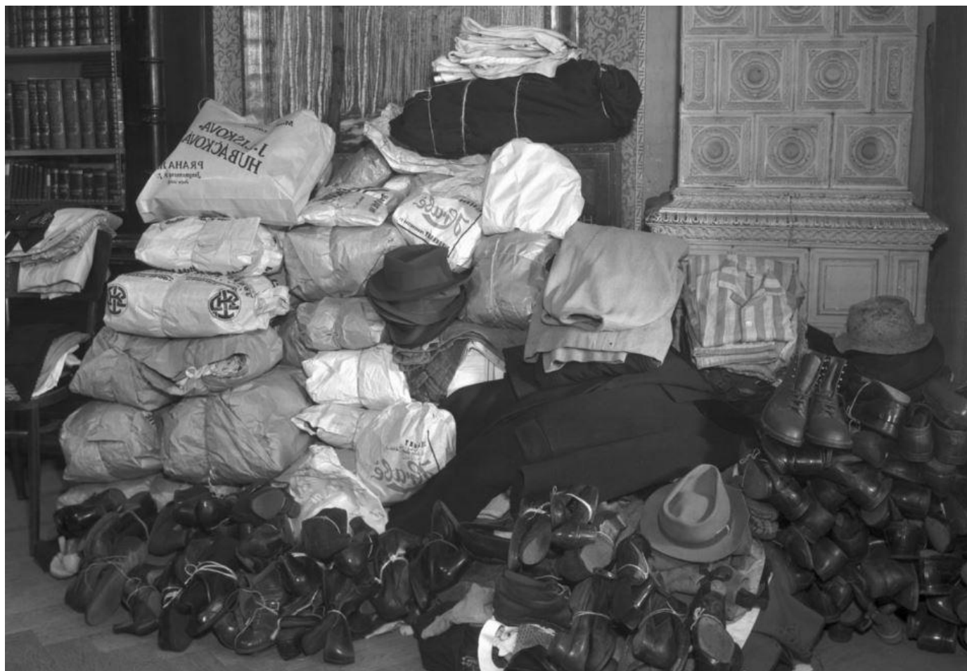
Sbírka šatstva pro uprchlíky v pražských sokolovnách.