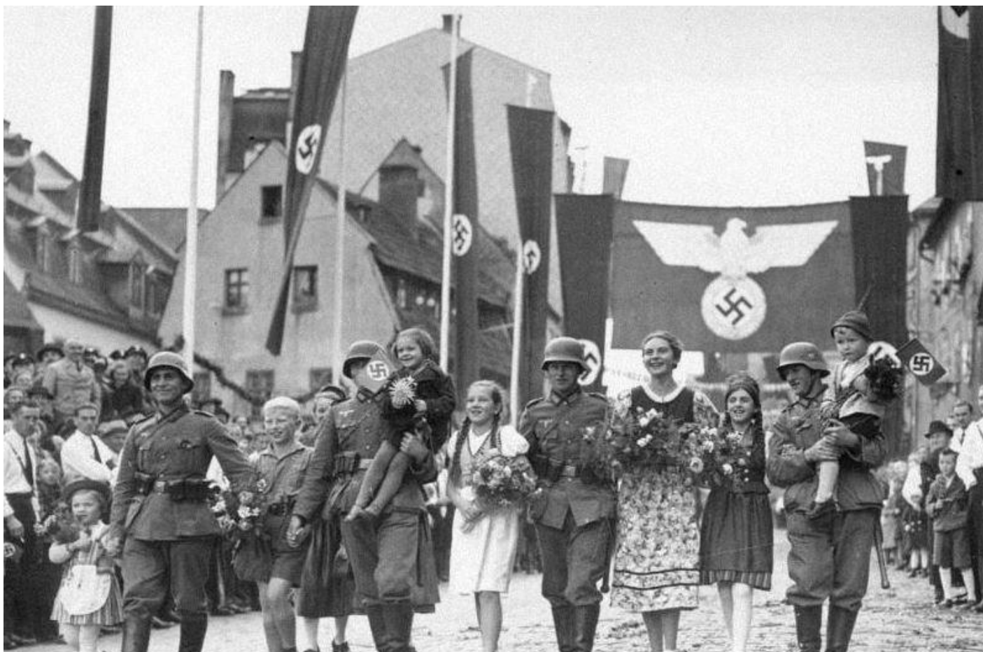
Propagandisticky pojatý snímek průvodu jednotek wehrmachtu, který vstoupil do Aše - 3. října 1938.