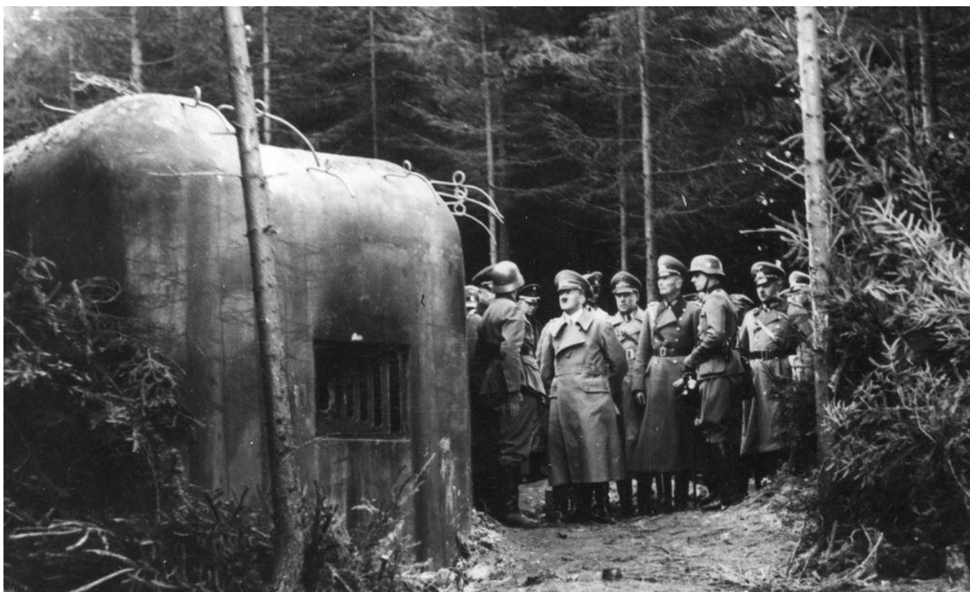
Vůdce nacistického Německa Adolf Hitler se s doprovodem seznamuje s obrannými objekty "československé Maginotovy linie". Zde je zachycen při prohlídce bunkru č. 30/N1/-180Z. 7. října 1938.