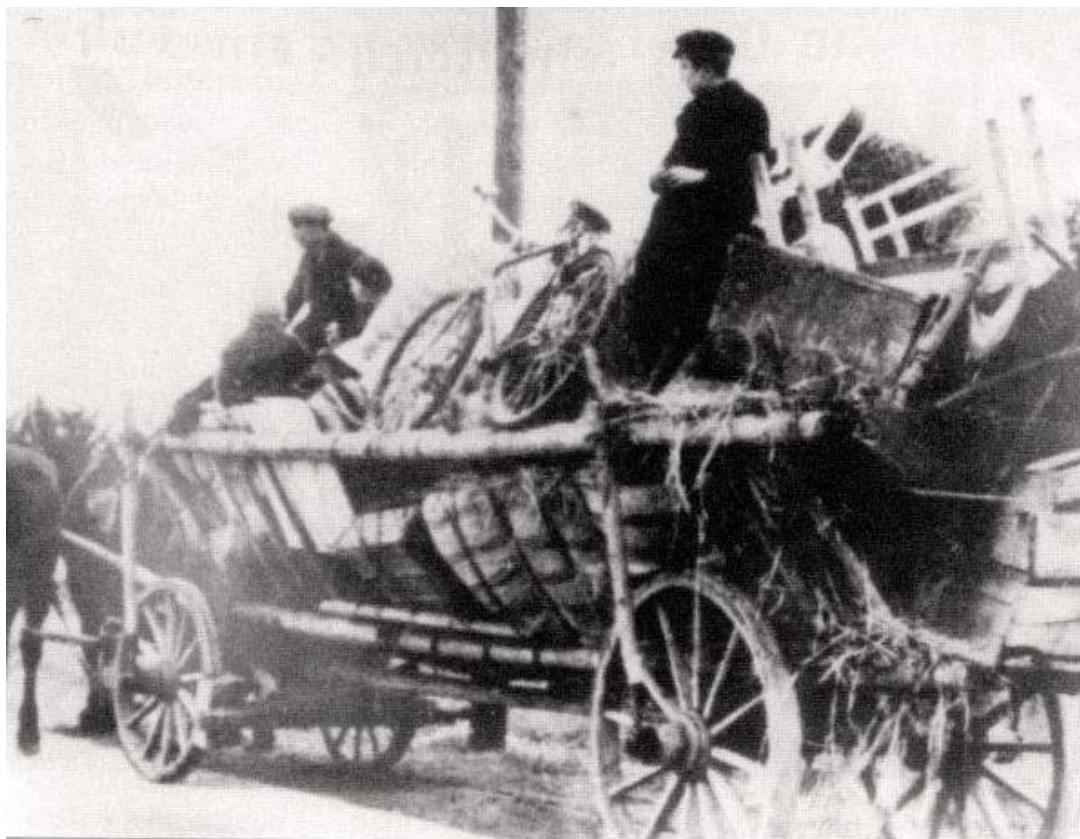
Čeští uprchlíci ze zabraného pohraničí na Břeclavsku si odvázejí majetek na žebříňácích - rovněž říjen 1938.