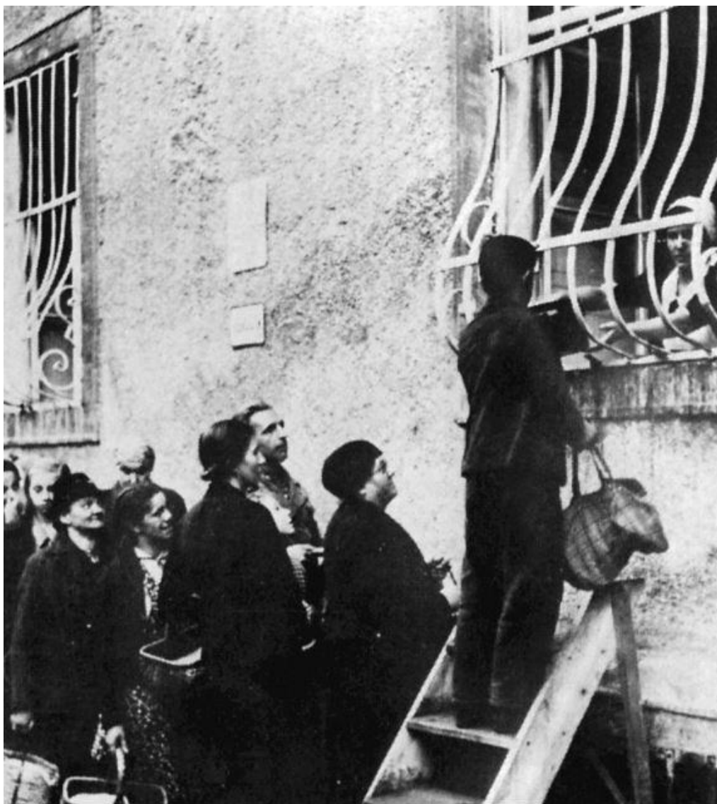
Vydávání obědů uprchlíkům ve sběrném táboře v Terezíně - říjen 1938.