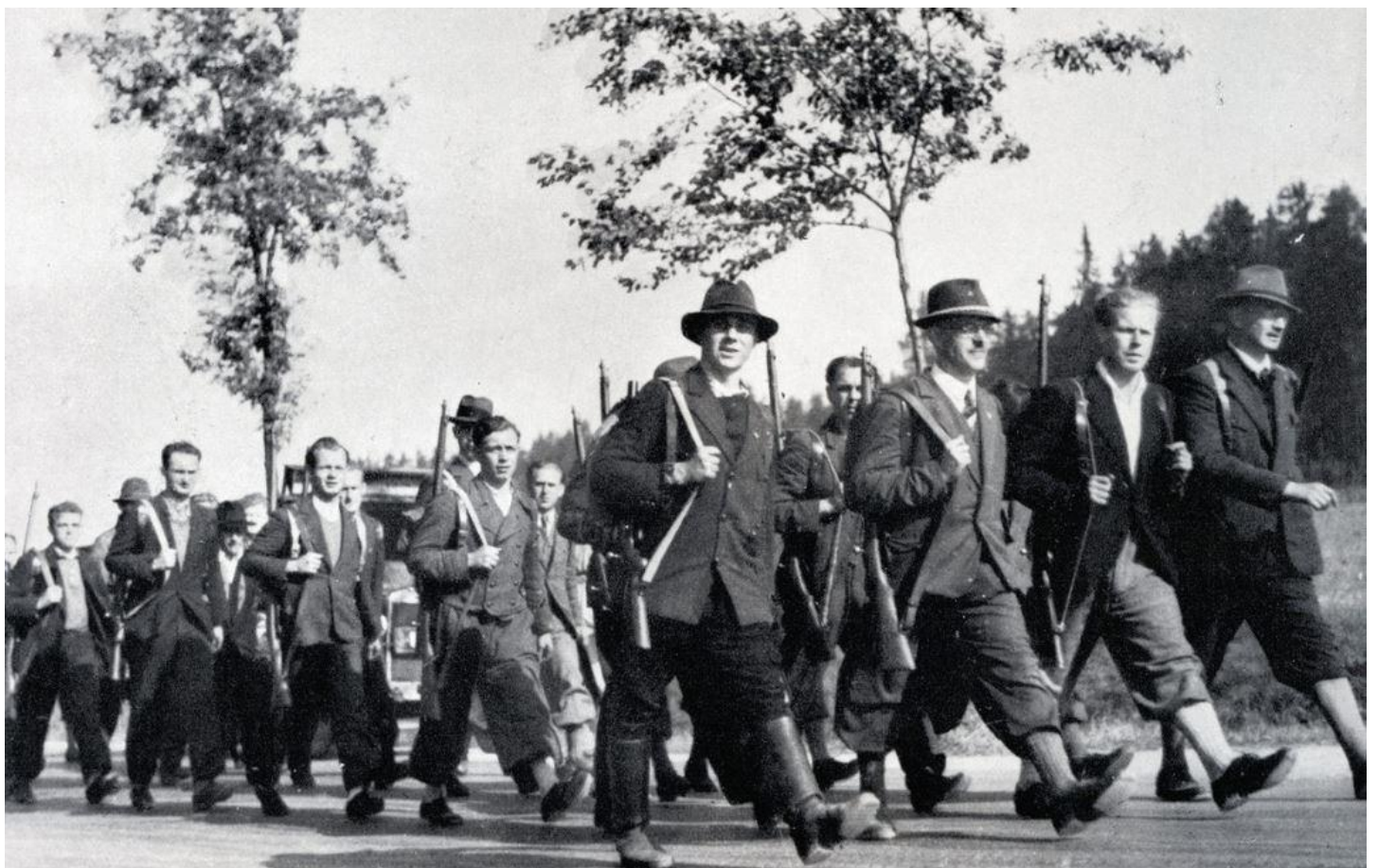
Pochod paramilitantních bojůvek Freikorpsu.