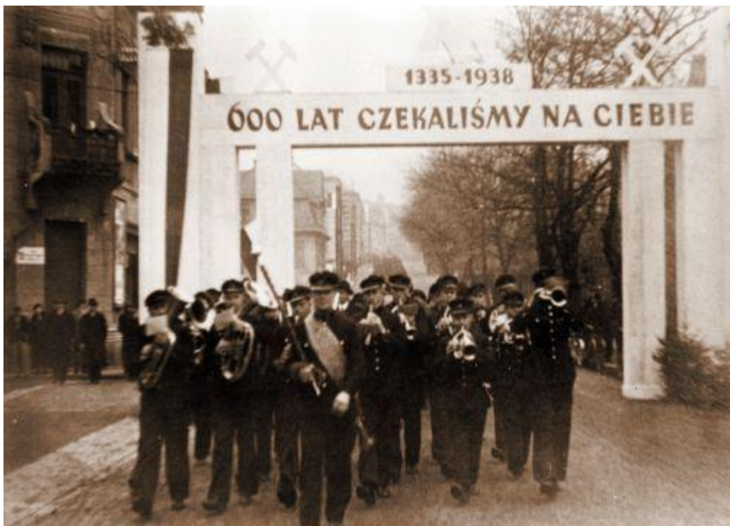
Průvod etnických Poláků oslavující anexi Karviné - říjen 1938.