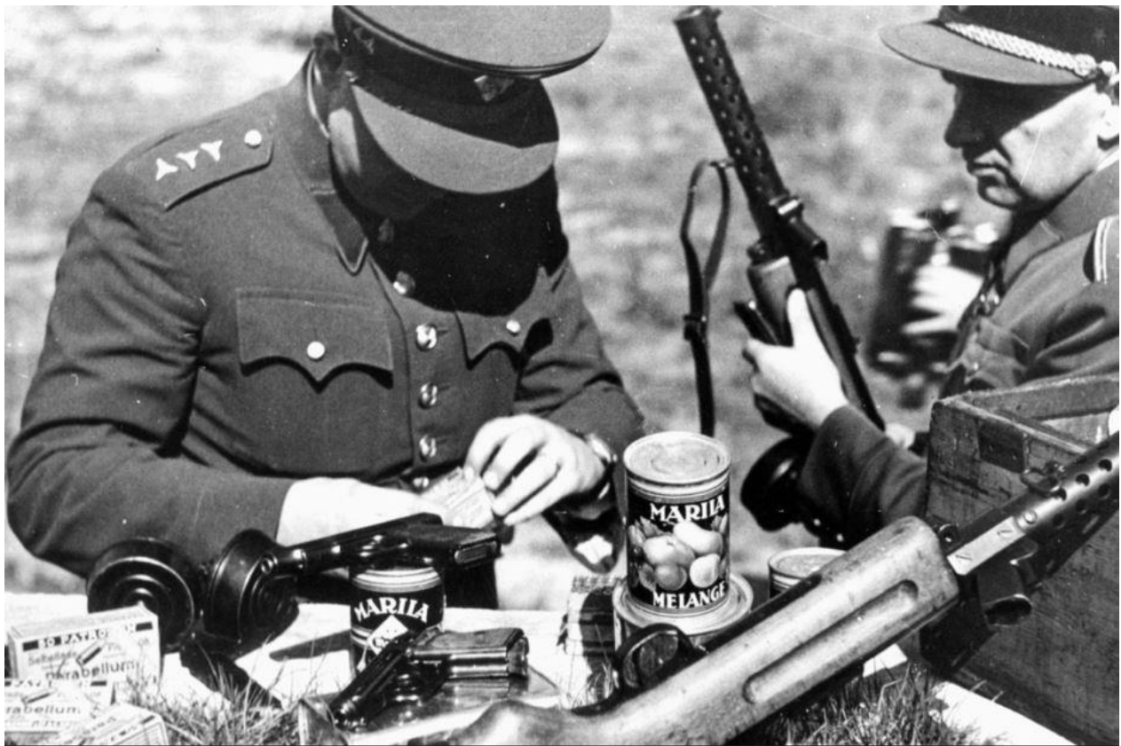
Čs. důstojníci na vojenské střelnici v Praze v Kobylisích předvádějí zástupcům tisku zabavené zbraně a trhaviny z proveniencie nacistické armádní rozvědky Abwehr. Čs. bezpečnostní složky zajistily tyto zbraně v Březí u Mikulova, u Frývaldova (Jeseník) či v Horním Dvoře (Oberhof).