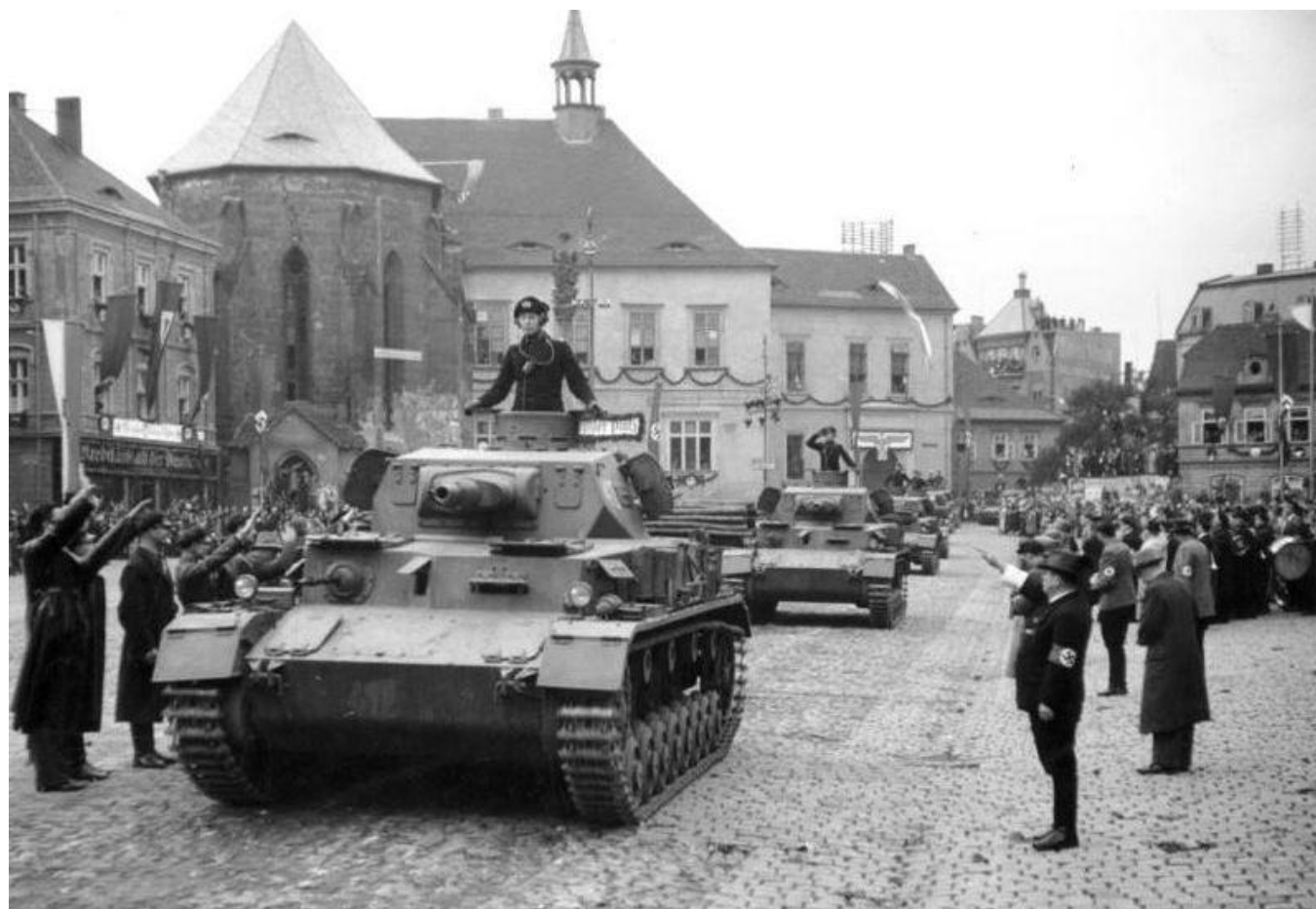
Těžké tanky wehrmachtu v Chomutově - říjen 1938.