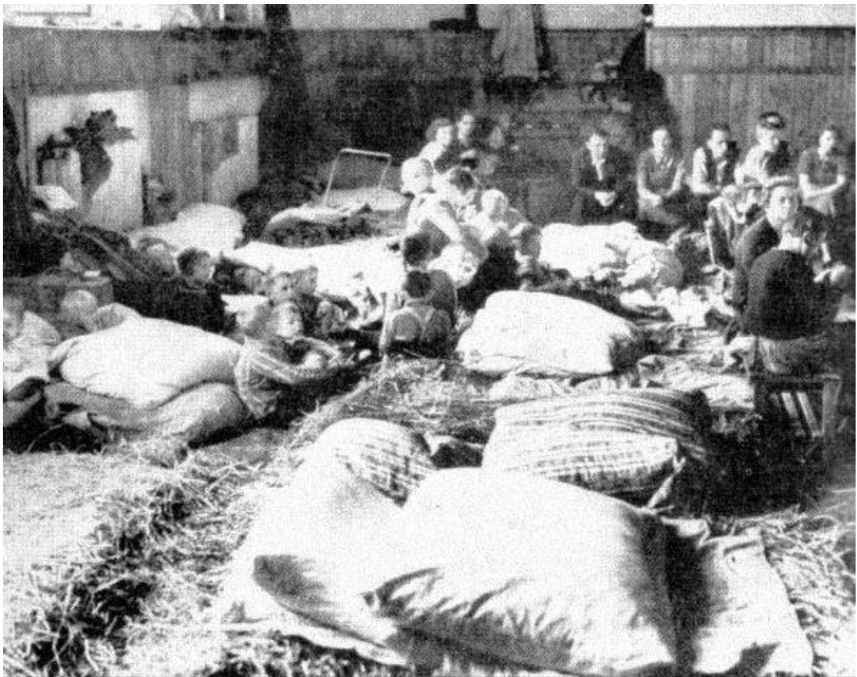
Čeští uprchlíci z pohraničí - říjen 1938.