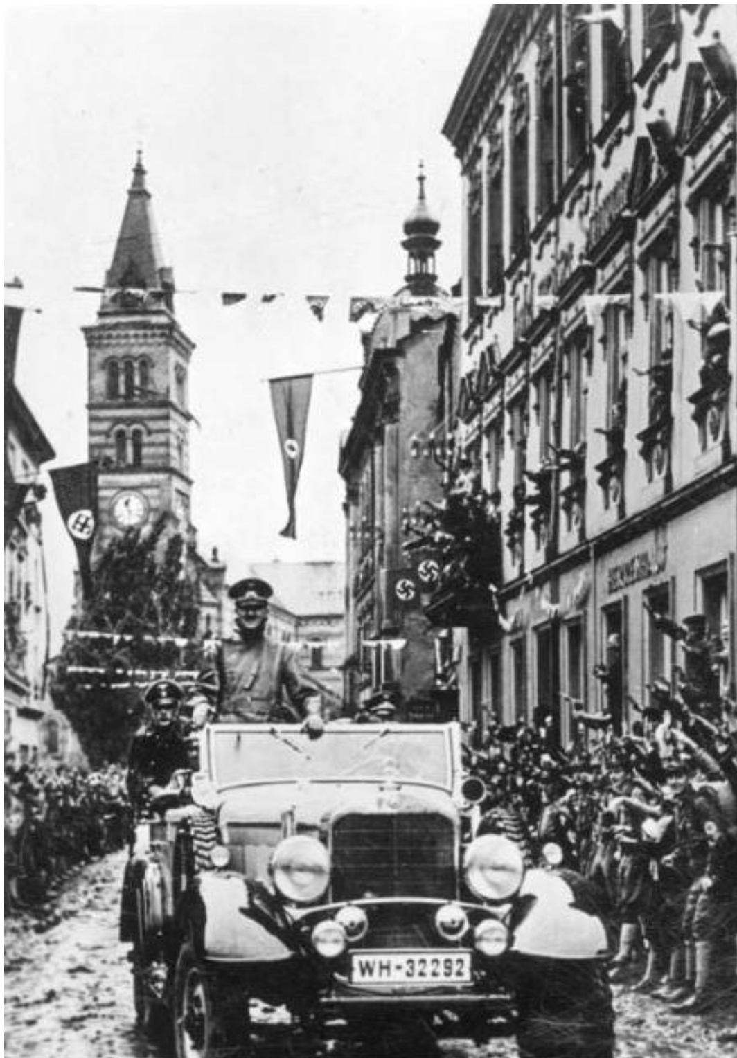
Adolf Hitler v Kraslicích na Sokolovsku - 4. října 1938.