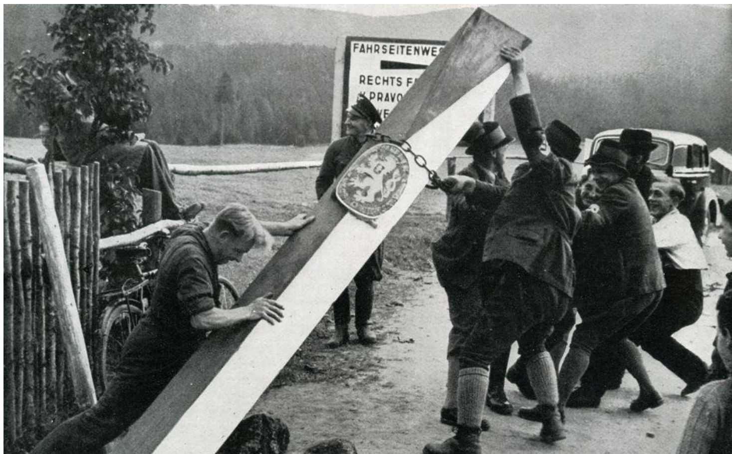
Henleinovci porážejí železný hraniční sloup na čs. státní hranici s Německem.