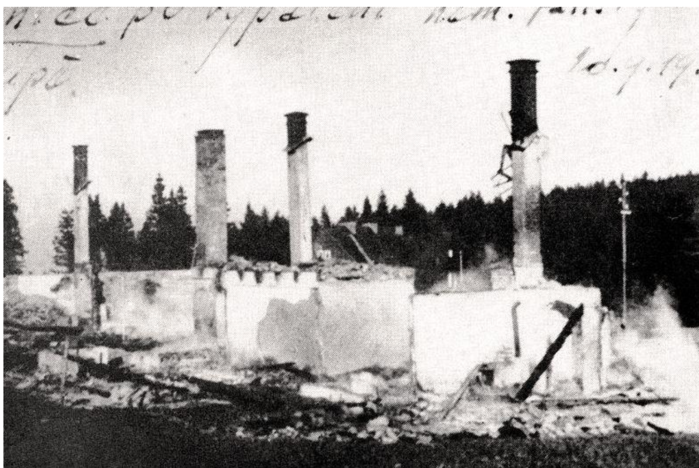
Trosky zničené celnice v Horní Malé Úpě po útoku sudetoněmeckého Freikorpsu v roce 1938.