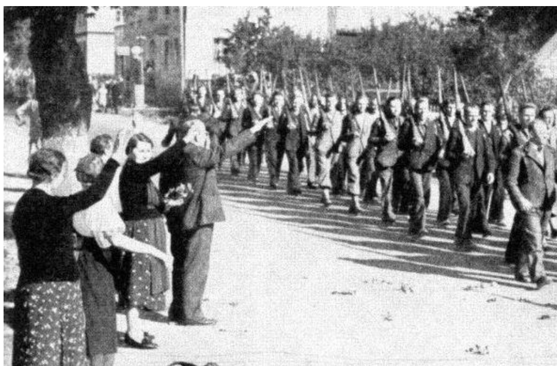
Defilující jednotky sudetoněmeckého Freikorpsu v roce 1938.