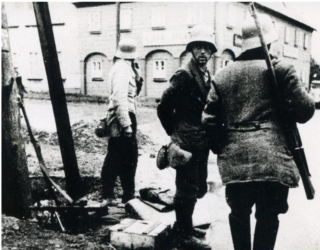
Hlídká ordnerů ve Varnsdorfu. V tomto severočeském městě došlo k přepadení pobočky Čs. národní banky a ulupení 18 milionů Kčs.