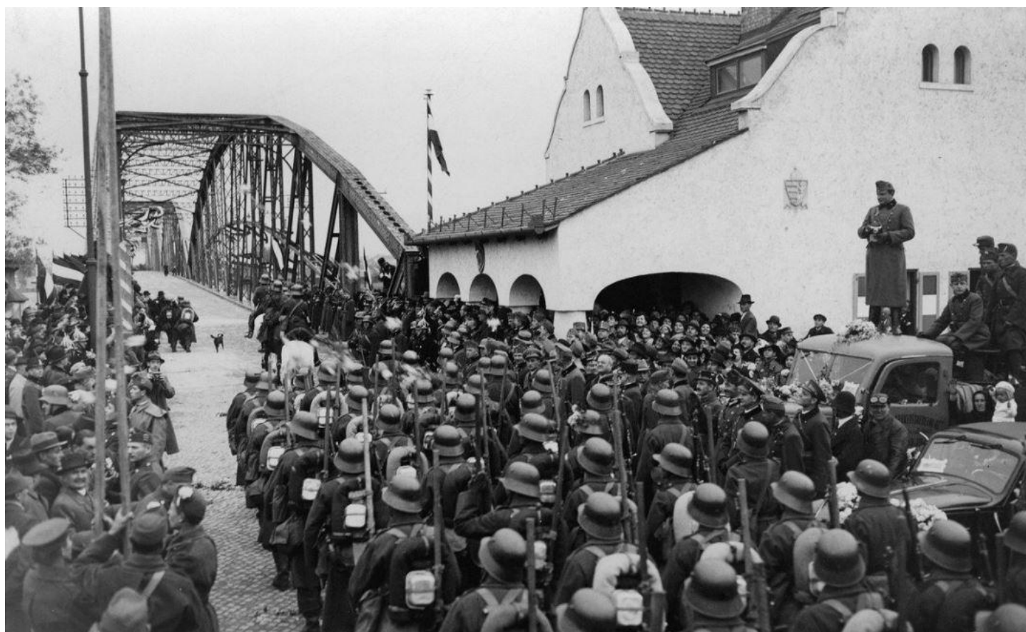
Jednotky maďarské armády obsazují Komárno na Slovensku - říjen 1938.