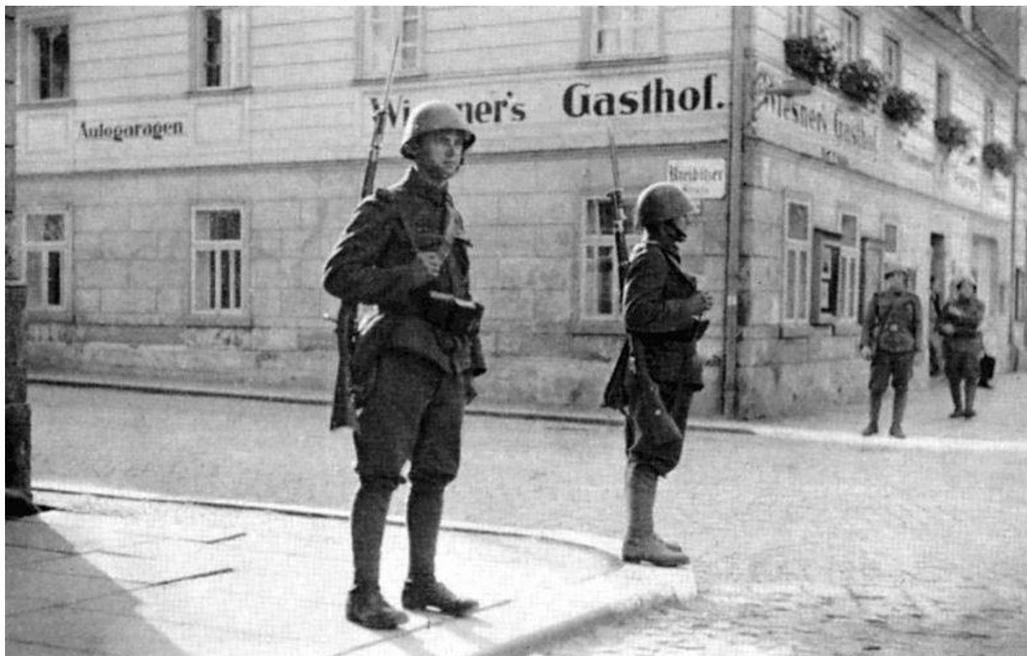
Českoslovenští vojáci hlídkující v Krásné Lípě počátkem října 1938.