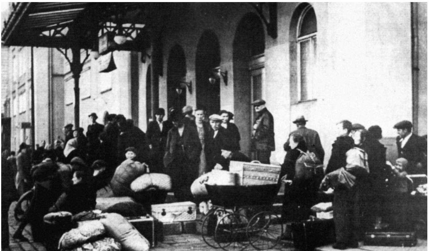
S sebou si mohli vzít jen omezené množství zavazadel.