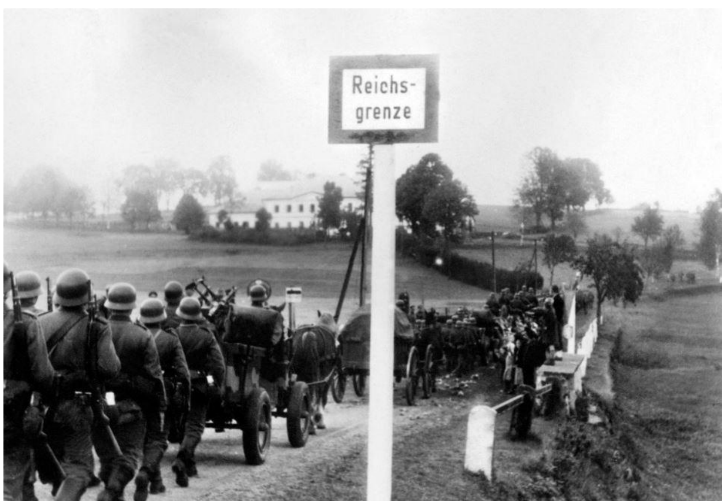
1. října 1938: nacistický wehrmacht obsazuje po mnichovské smlouvě československé pohraničí.