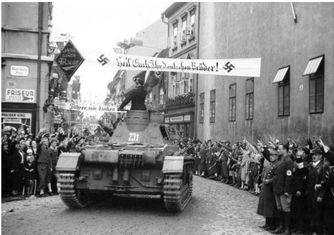
Oslavný průjezd těžkých tanků wehrmachtu v Chomutově - 9. říjen 1938.