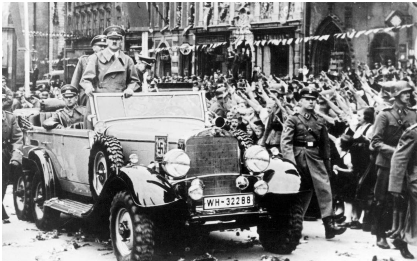
Triumfální přivítání Adolfa Hitlera v Chebu.