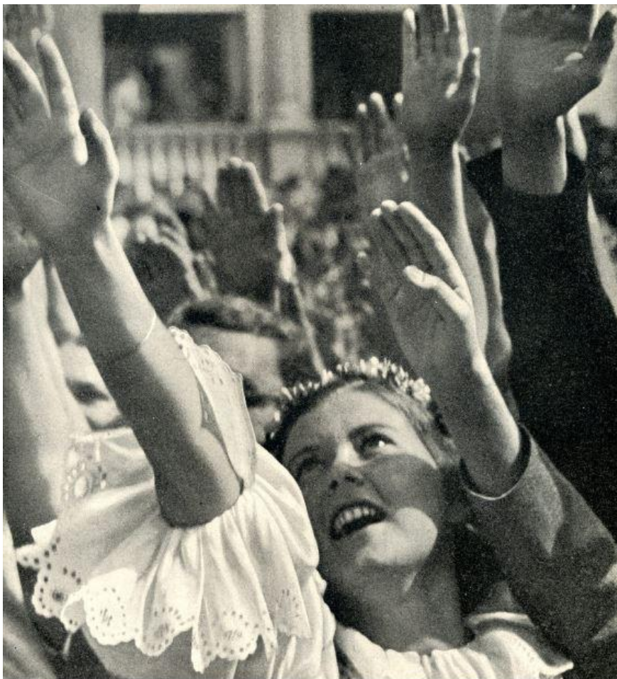
Davem rezonovalo mohutné provolávání nacistického pozdravu "Sieg heil!".