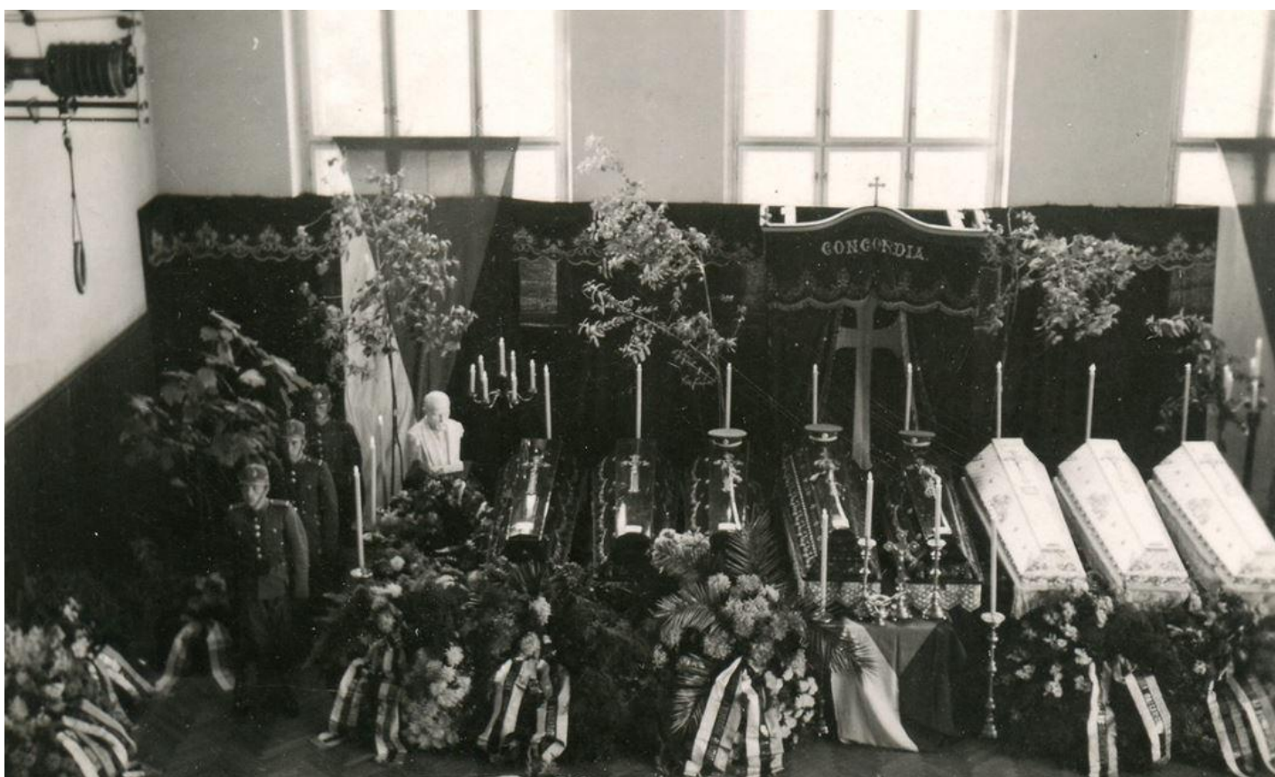
Čestná stráž u katafalku osmi zavražděných četníků, kteří zahynuli při přepadu ordnerů stanice ve Falknově (dnes Sokolov) v září 1938.