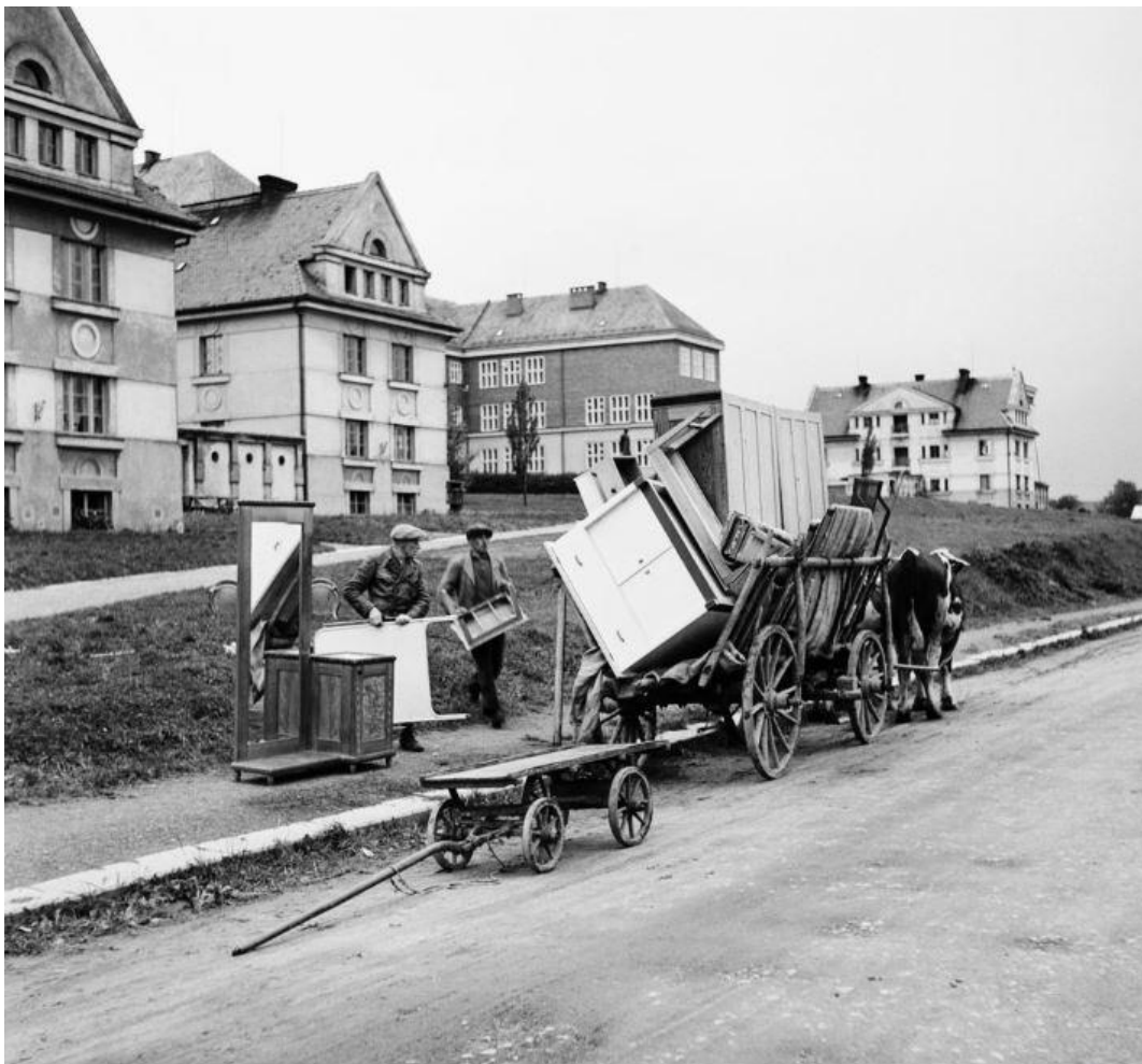
Evakuace českého obyvatelstva z Píličky - 8. října 1938.