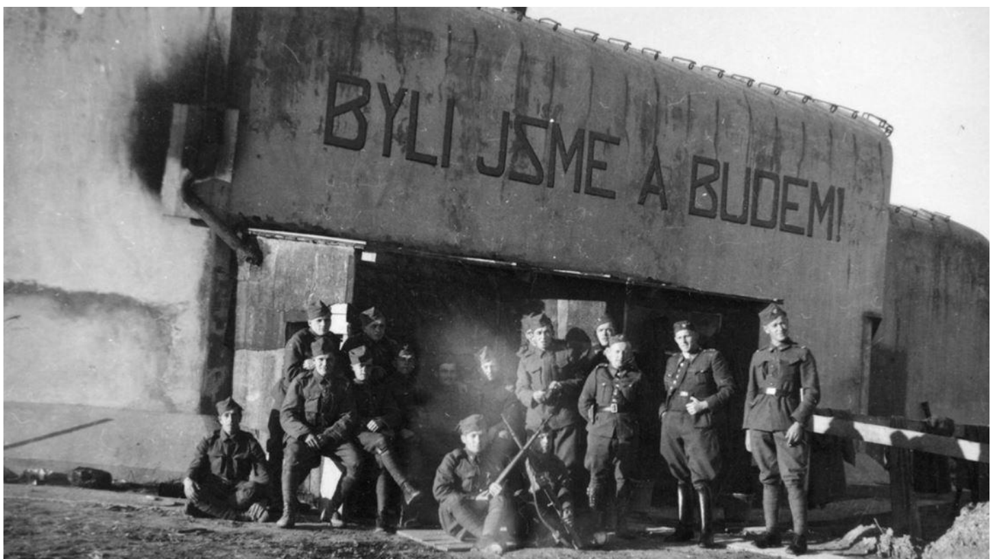
Posádka při mobilizaci čs. bunkru K-S 14 "Cihelna" v Králíkách. Na oboustranném pěchotním srubu byl nápis "Byli jsme a budeme!".