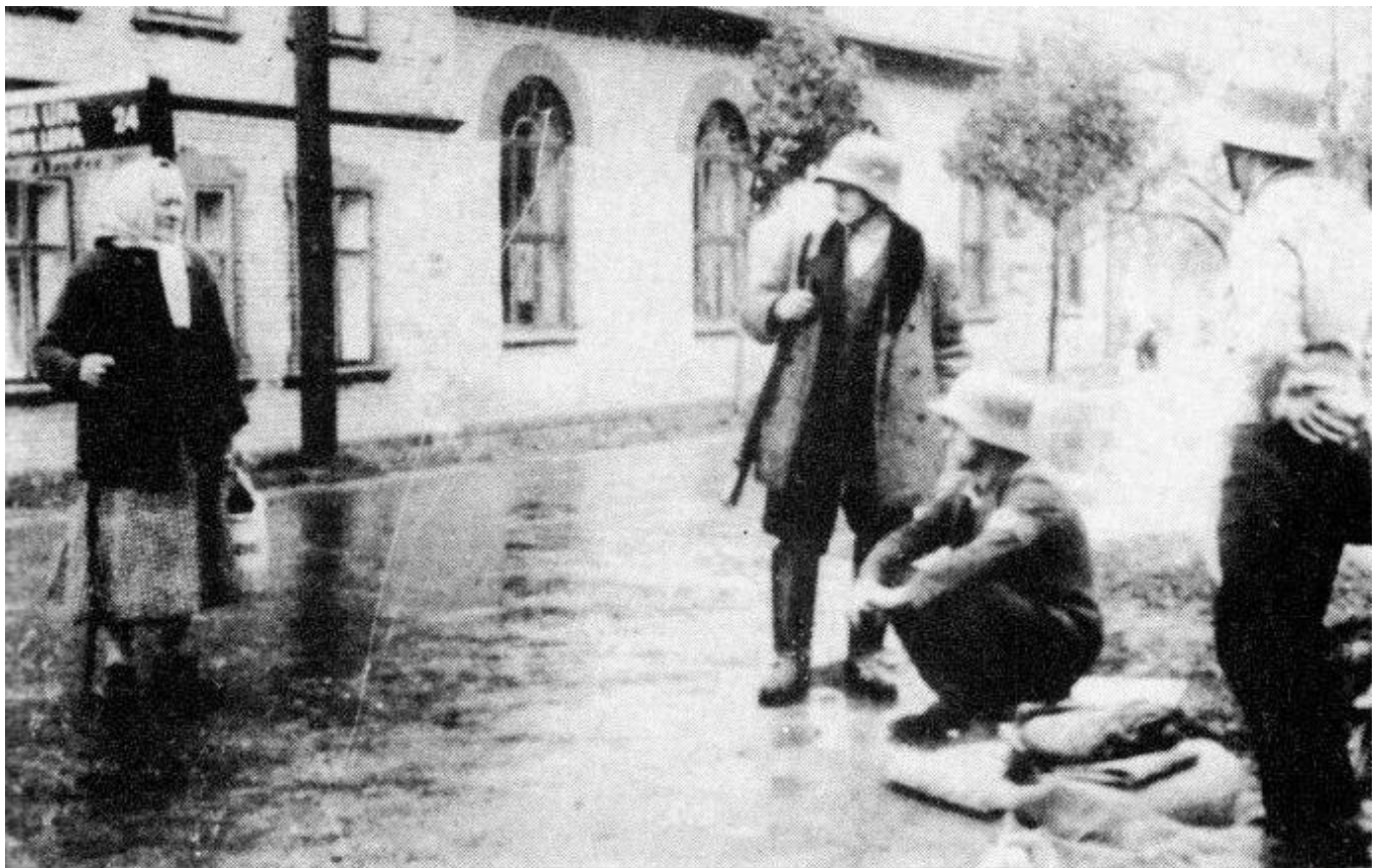
Sudetoněmecký Freikorps nedaleko České Lípy. Rok 1938.