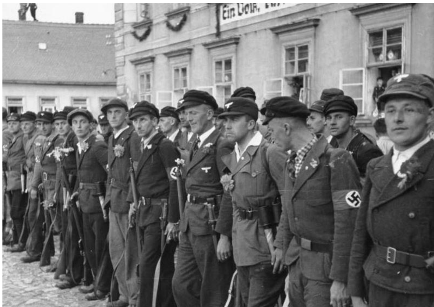
Členové Freikorpsu čekají na příjezd Adolfa Hitlera v Mimoni na Českolipsku - 10. října 1938.