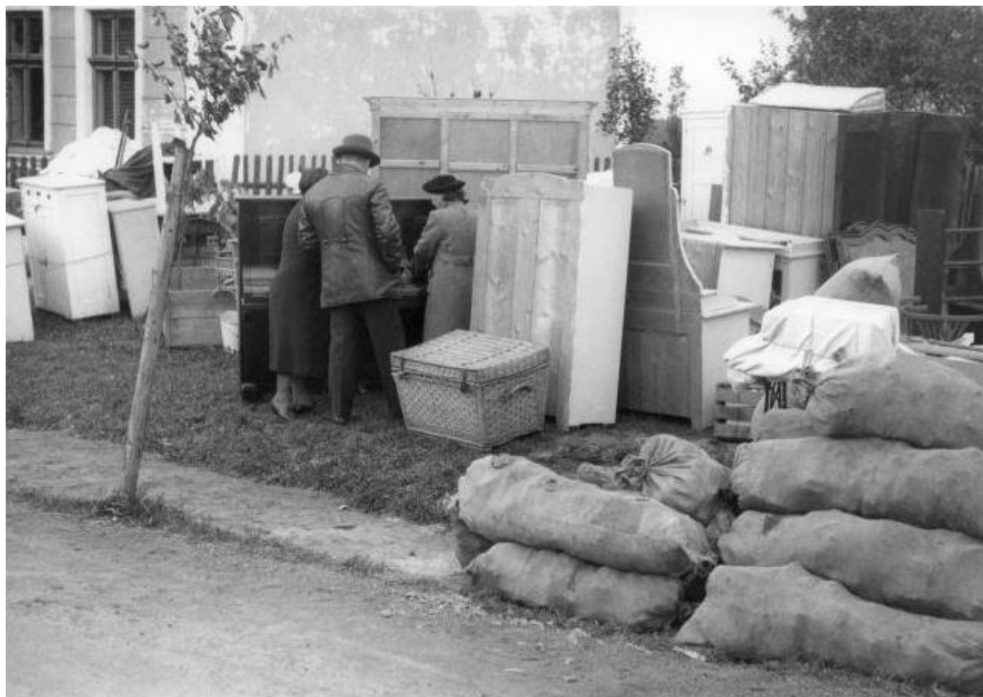
Čeští vystěhovalci z polského pohraničí po mnichovské dohodě.