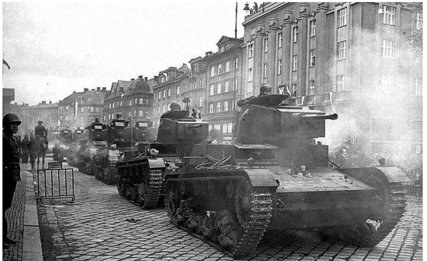
Polská armáda obsazuje po Mnichovu Zaolzie (česky Záolží či Záolší), východní díl české části Těšínska, kde převažovalo obyvatelstvo hlásící se k polské národnosti.