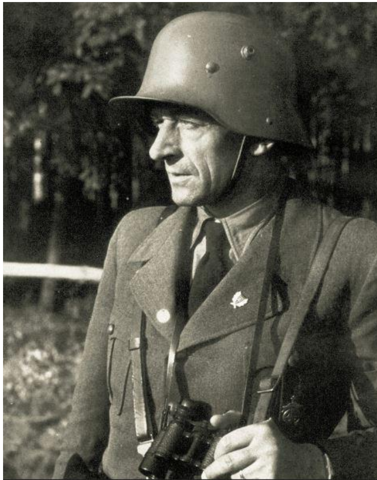
Proměna bývalého čs. poslance K. H. Franka je ze snímku více než patrná. Zde již na vlně militarizace pózuje v armádní přilbě.