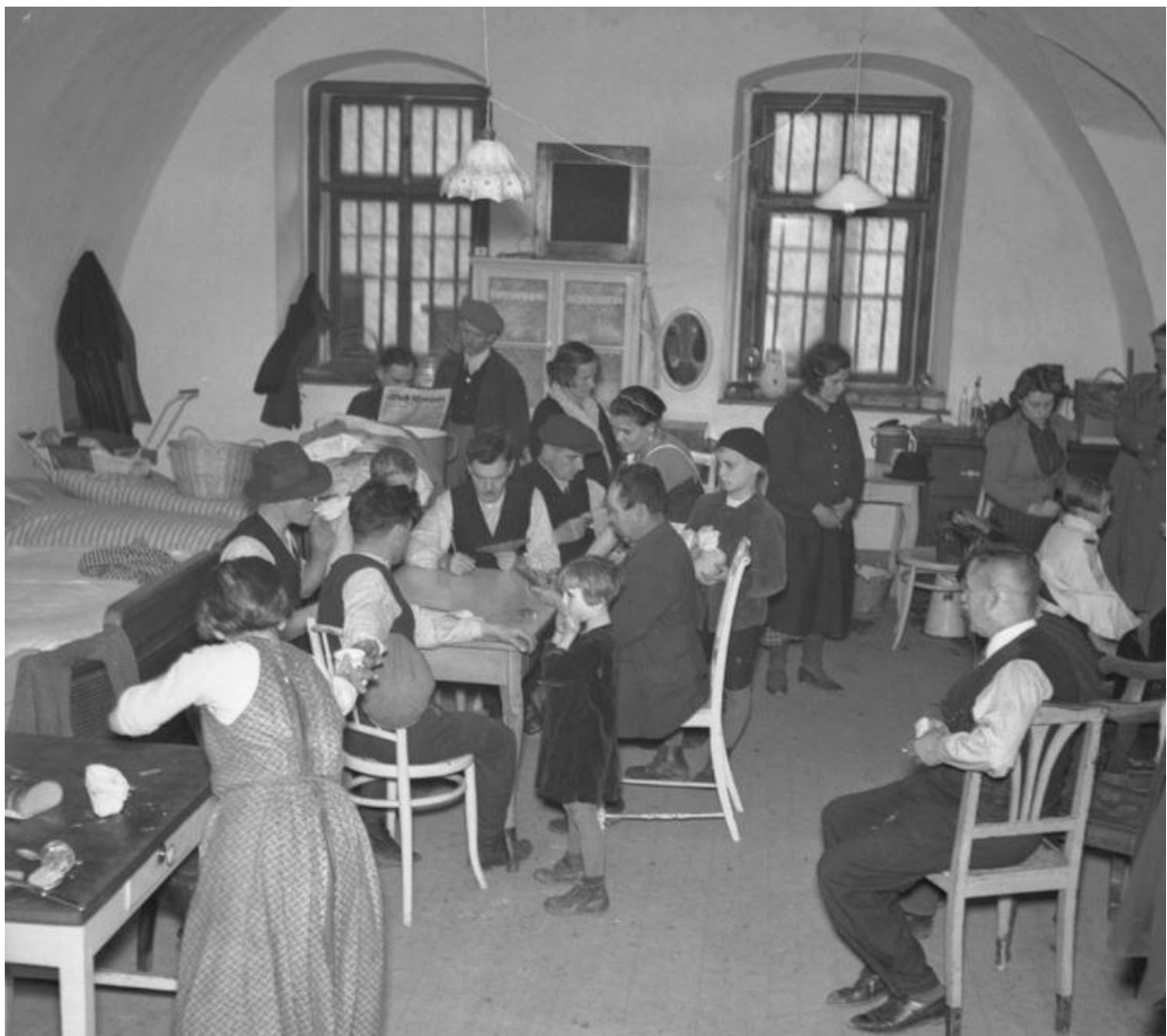
Terezínský tábor uprchlíků z čs. pohraničních krajů.