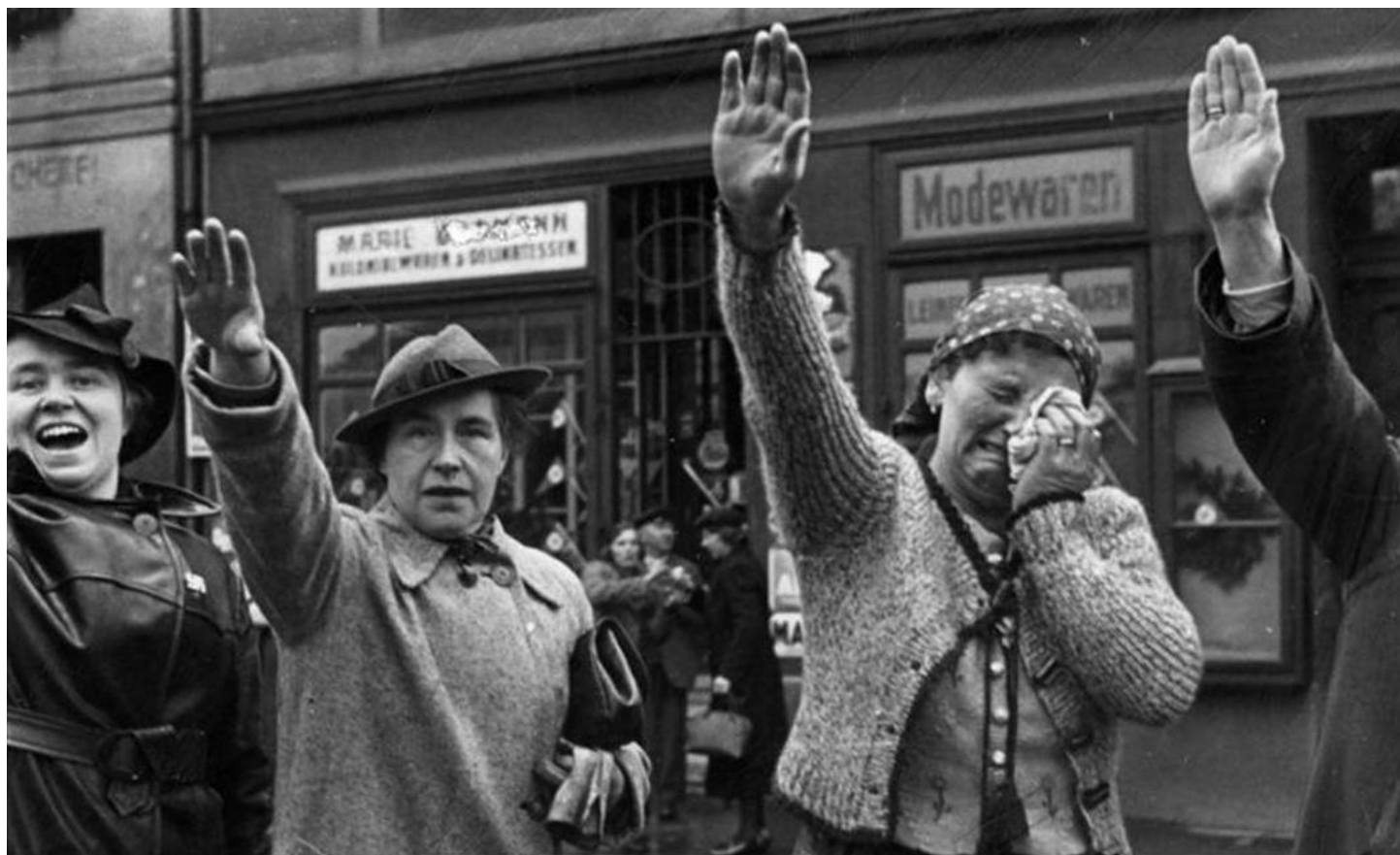
Sudetské Němky vítají v Chebu hajlováním Adolfa Hitlera.