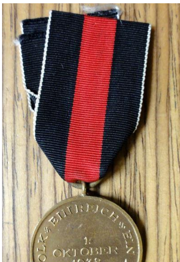
Zadní strana německé medaile, která upomínala na připojení čs. pohraničí k nacistické říši - říjen 1938.