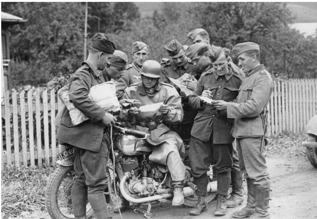
Němci, kteří ještě nedávno sloužili v československé armádě, nyní ve společnosti vojáků wehrmachtu - říjen 1938.