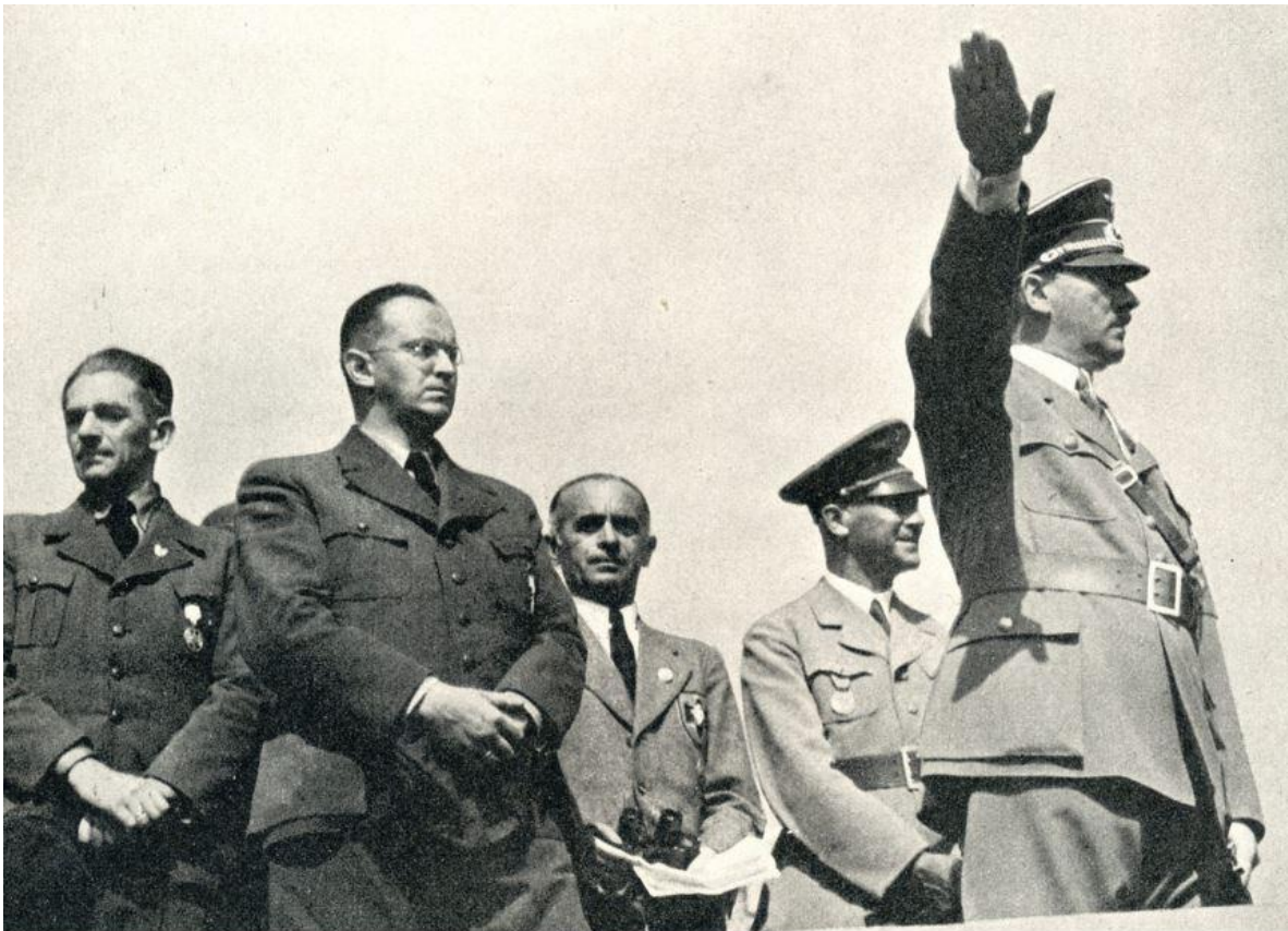
Adolf Hitler zdraví davy sudetských Němců během Turnfestu v Breslau. V tomto čase se již rodila tajná směrnice k útoku proti Československu - 4. června 1938.