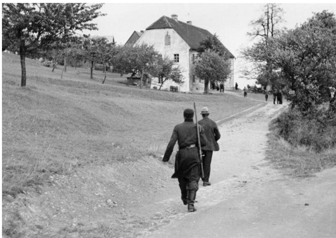
Freikorps obsazuje české pohraničí - 4. října 1938.