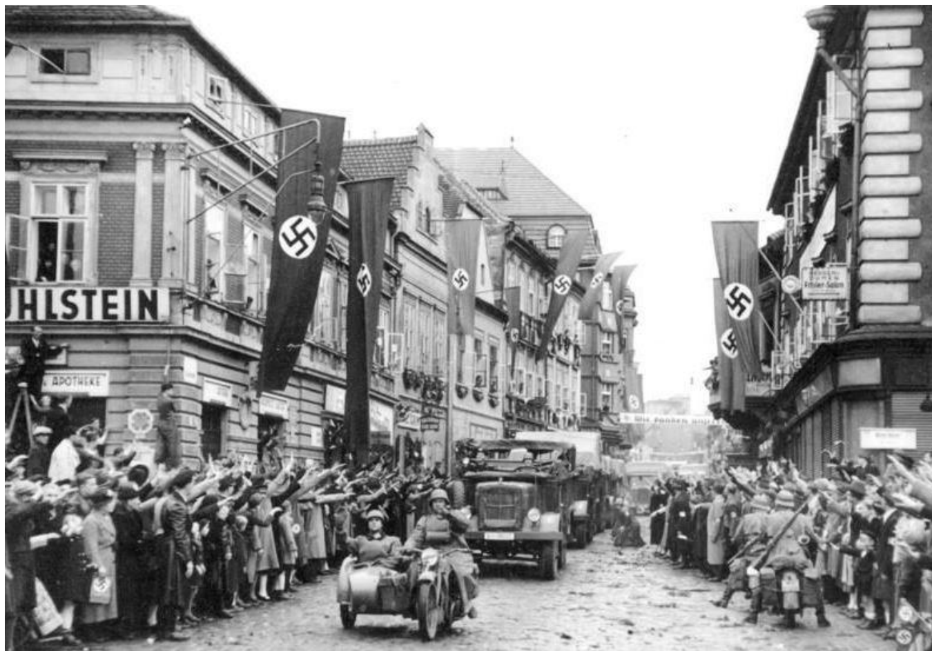
Wehrmacht při průjezdu Žatcem - 9. října 1938.