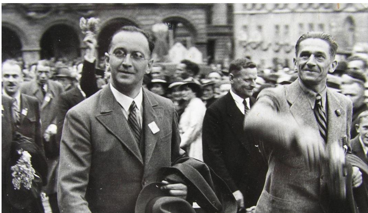
Konrad Henlein (vlevo) a sudetoněmecký radikál Karl Hermann Frank (1898-1946) patřili mezi hlavní nositele "pochodně nacismu" v příhraničních oblastech Československa sousedících s nacistickým Německem.