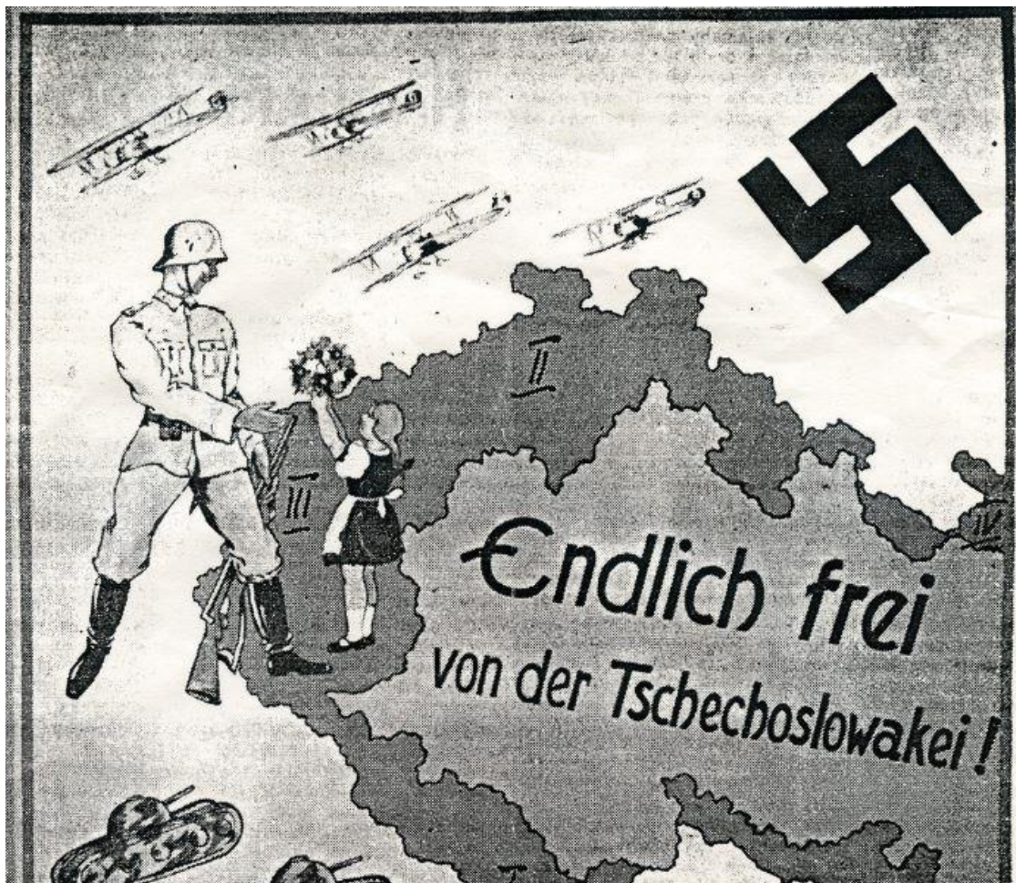
"Endlich frei von der Tschechoslowakei!" Jeden z mnoha sudetoněmeckých propagandistických plakátů děkujících za připojení k nacistické říši.