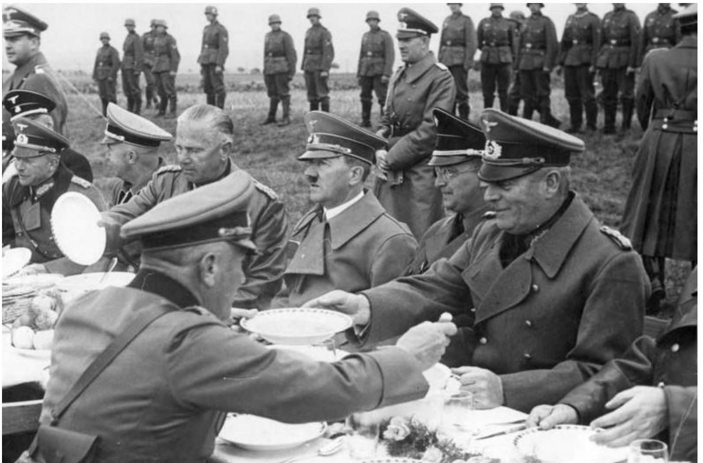
Adolf Hitler ve společnosti německých generálů a Konrada Henleina obědvá nedaleko Františkových Lázní - 3. října 1938.