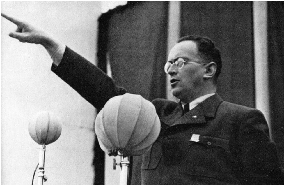
Hlavní strůjce "páté kolony" v Československu Konrad Henlein (1898-1945). Zakladatel a čelný představitel politického hnutí Sudetendeutsche Heimatsfront, které se v roce 1935 přeměnilo na Sudetendeutsche Partei (SdP).