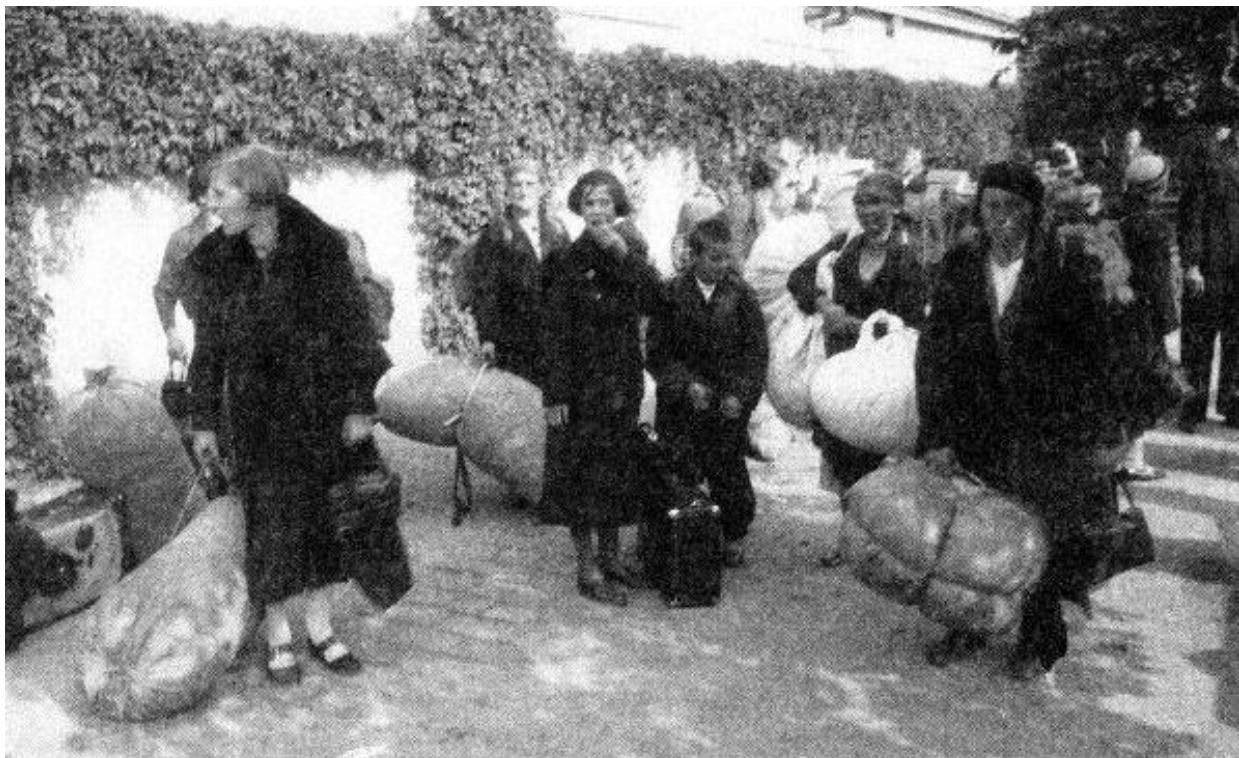
Češi vyhnání z pohraničí hledají nové domov - říjen 1938.