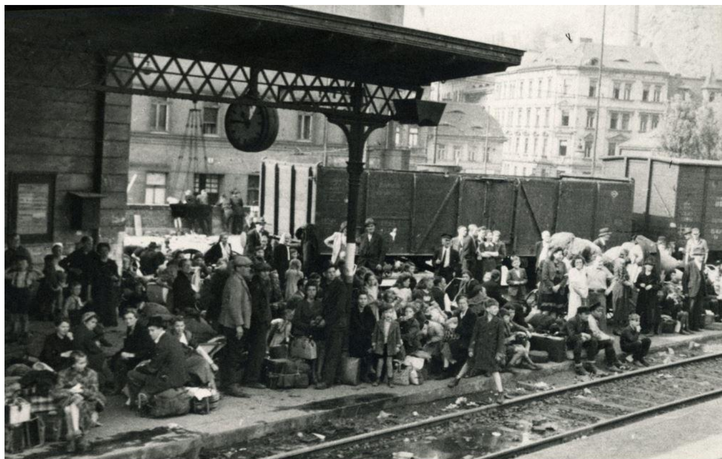
Čeští uprchlíci z hitlerovci obsazeného pohraničí. Praha - říjen 1938.