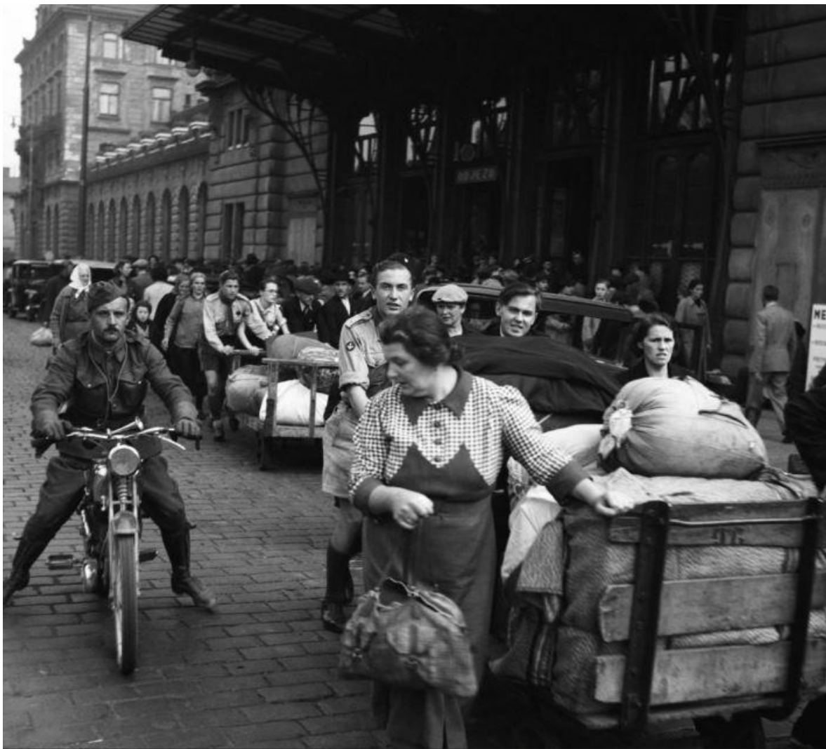
Češi prchající před nacistickým terorem našli v Praze útočiště v několika lokalitách: na Strahově, v Tyršově domě či v různých tělocvičnách a prostranstvích.