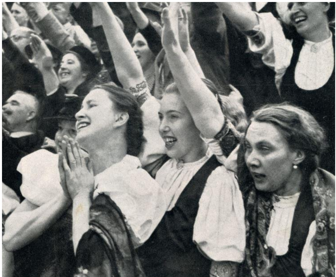
V opojení ideami nacismu a vyostřeného nacionalismu se až s hysterickou vervou hajlovalo.